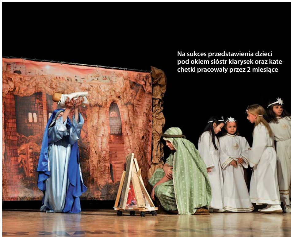
Na sukces przedstawienia dzieci pod okiem siostr klarysek oraz katechetki pracowały przez 2 miesiące