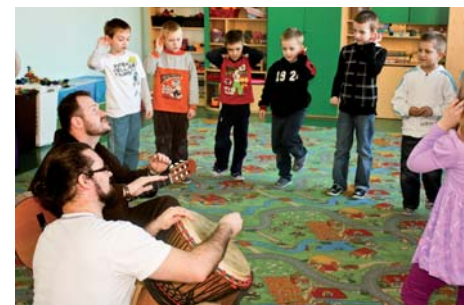
Spotkanie dostarczyło wiele radości