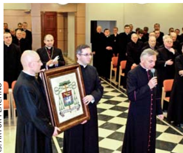
KS. ARTUR PŁACHNO Pasterz diecezji otrzymał mozaikę przedstawiającą jego herb biskupi

Odpowiadając na te życzenia, Ksiądz Biskup zwrócił też uwagę na potrzebę wzmocnienia wspólnot kapłańskich, tak aby stawały się one