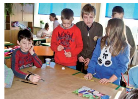
Podczas przygotowywania obrazków na wystawę misyjną