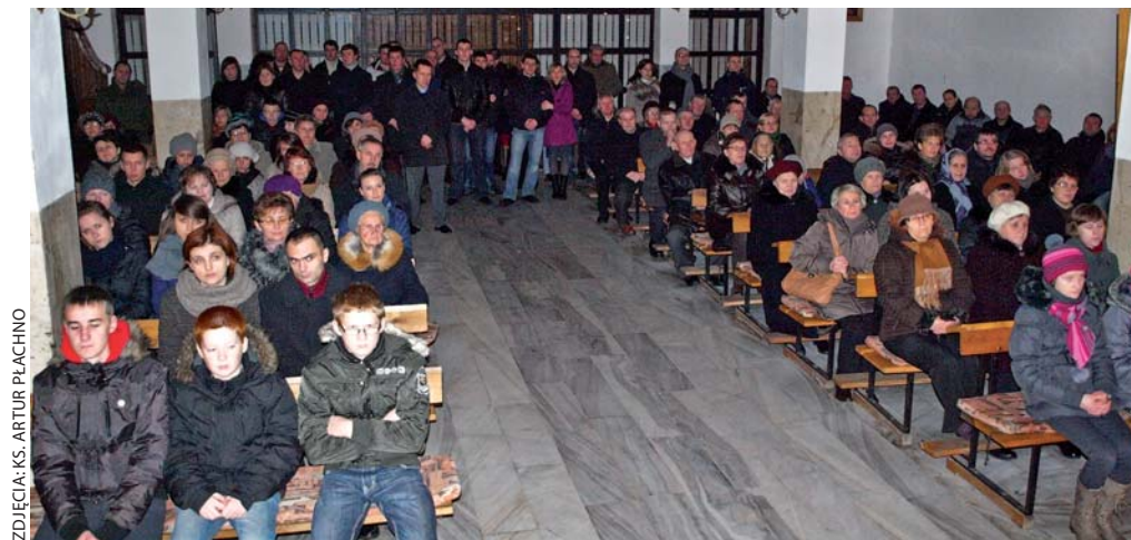
Na uroczystość 400-lecia parafii przybyło wielu parafian